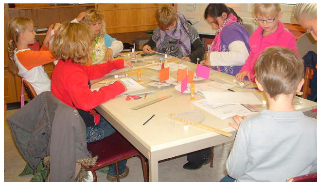
oben: Schülerinnen und Schüler aus Friedland beim Zusammenbau von Windklappen zur Windmessung

Das Programm zur Entwicklung solcher Materialien umfasst Unterlagen zum Wind und zur Nutzung des Windes als erneuerbare Energie, zur Sonnenstrahlung und zu deren Nutzung, sowie zur Luftfeuchte. Für alle diese Themen ist langfristig vorgesehen, unterschiedlich anspruchsvolle Materialien je nach Klassenstufe zu entwickeln. Die Materialien sollen den Schulunterricht in den Fächern Geografie, Physik, Chemie und Mathematik durch interessante Anschauungen und Experimentiermöglichkeiten unterstützen.