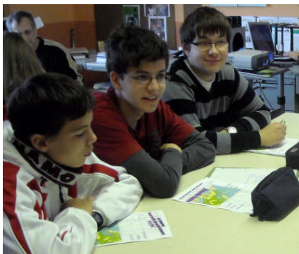
Foto zeigt Schüler des Gauß-Gymnasiums Frankfurt (Oder) am 15.11.2010) oder auch in den jeweiligen Schulen (z.B. am 23.11. in Eisenhüttenstadt am Schweitzer-Gymnasium).

Im Rahmen des EWE-geförderten Projektes wurden aber auch Projektstunden zum Klimawandel angeboten und „ausprobiert“. Dies geschah entweder in Lindenberg (das