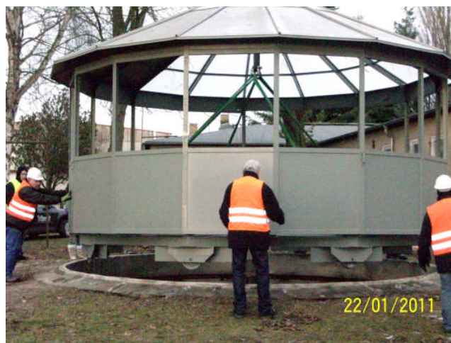
Foto vom 22.1.2011, das drehbare Windenhaus ist gerade von der Hüllensanierung zurückgekehrt und wird in den Fundamentrahmen mit Laufschiene eingepasst